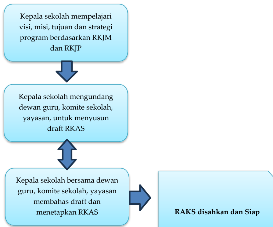
Gambar 4. Skema Perencanaan Keuangan Berupa RKAS di SMP Labschool UNESA

Berdasarkan pada hasil temuan, maka dapat disimpulkan bahwa perencanaan keuangan di SMP Labschool UNESA sudah dijalankan dengan baik meskipun dalam beberapa tahapan prosesnya terdapat tahapan yang berbeda. Hal ini dapat dilihat dari pelibatan seluruh stakeholder sekolah dalam perumusan rencana yang akan dilaksanakan untuk satu tahun ajaran.